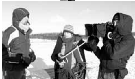
- photo de tournage, Québec, 2006