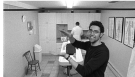
- photo de tournage, Québec, 2006