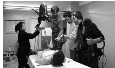
- photo de tournage, Québec, 2006